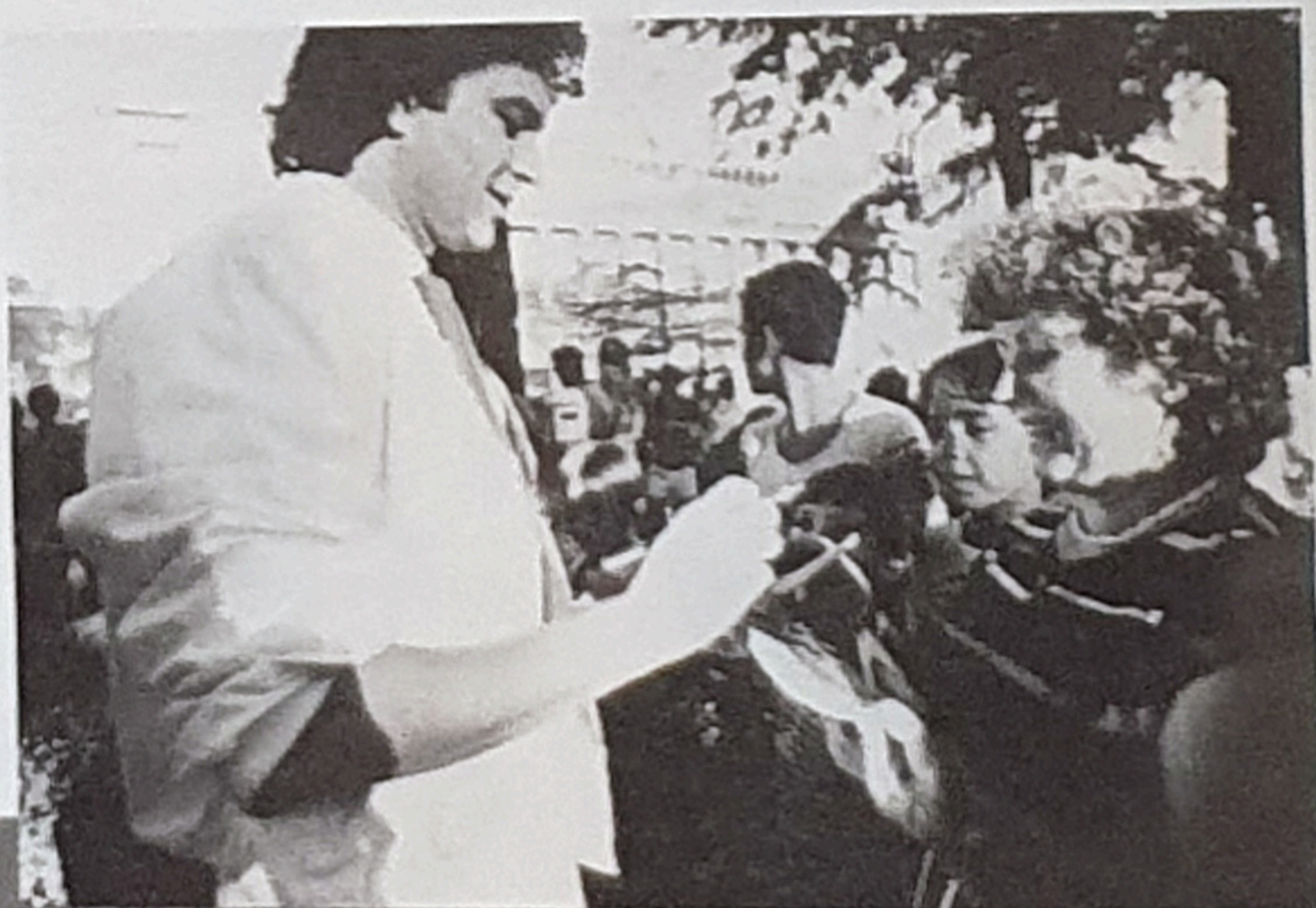
▲スペイン的情熱をたたえた彼のまなざしとルックスが、女性にはたまらない魅力。

◀彼はどこへ行っても熱狂的なファンにとり囲まれる。握手せめて、両手の甲は爪の傷が絶えない。